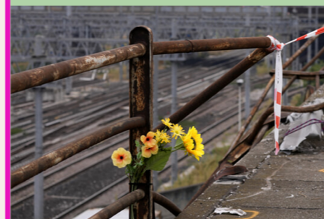
Bus precipitato, Mestre 2023 fare verità sui responsabili 21 morti e 15 feriti