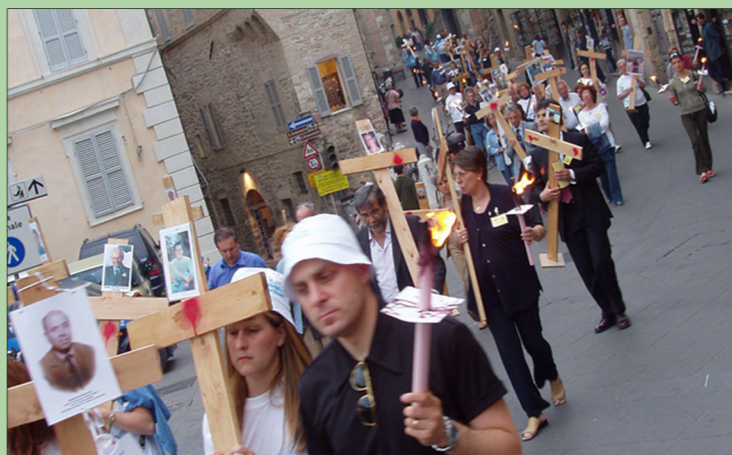
AIFVS Manifestazione delle croci Assisi

Di fronte a questi risultati negativi è inaccettabile che le istituzioni non si siano interrogate sulle loro responsabilità, come se la strage stradale fosse un fatto privato, e non il risultato di un servizio pubblico che non riesce a garantire la vita sulla strada e ad eliminare in tempo utile le condizioni di rischio, vuoi per problemi di organico, o di gestione delle risorse, o di interventi effettuati dopo che le criticità esistenti hanno già spezzato una vita.