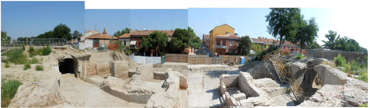
Dopo la demolizione della Scuola Bianca Merletti, durante gli scavi archeologici