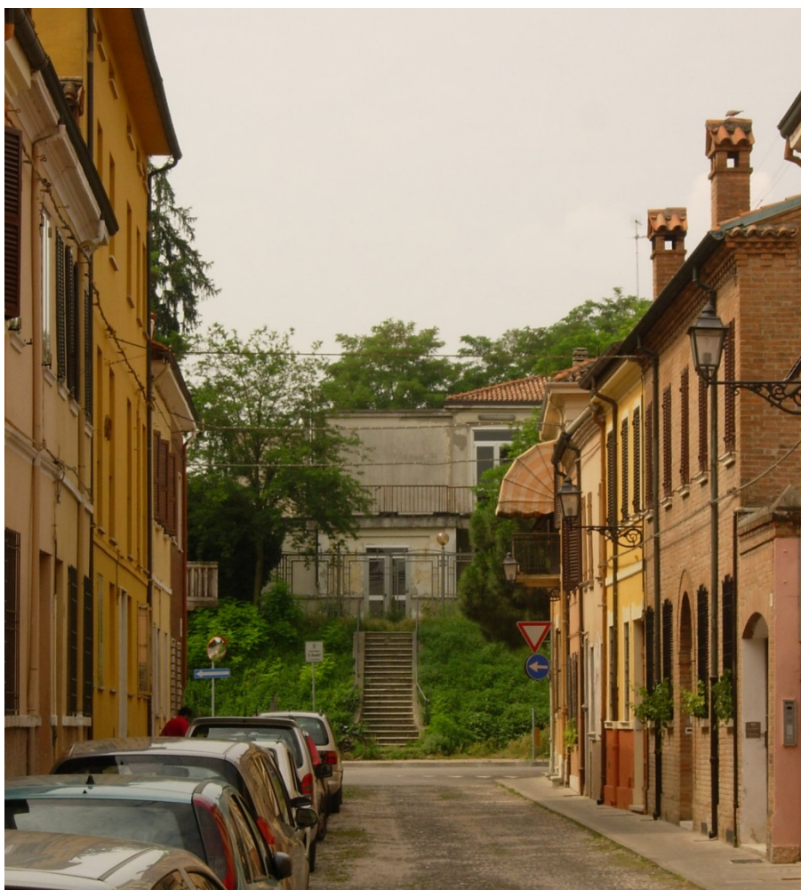
Vista da Via Porta d'Amore prima della demolizione della Scuola Bianca Merletti