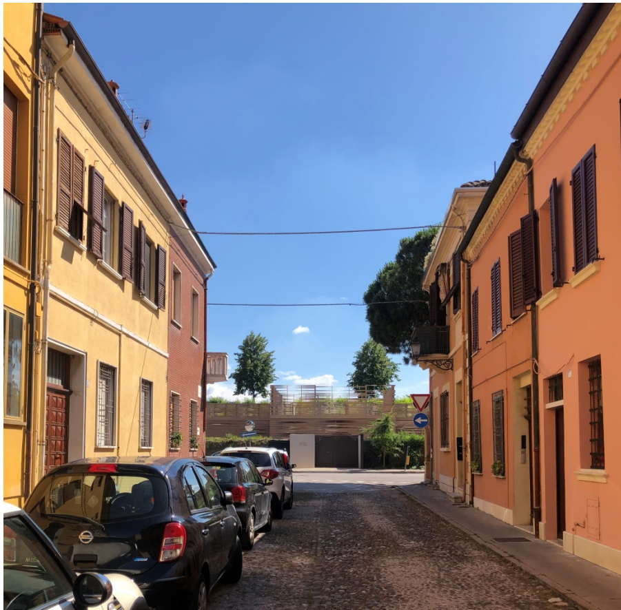
Vista da Via Porta d'Amore