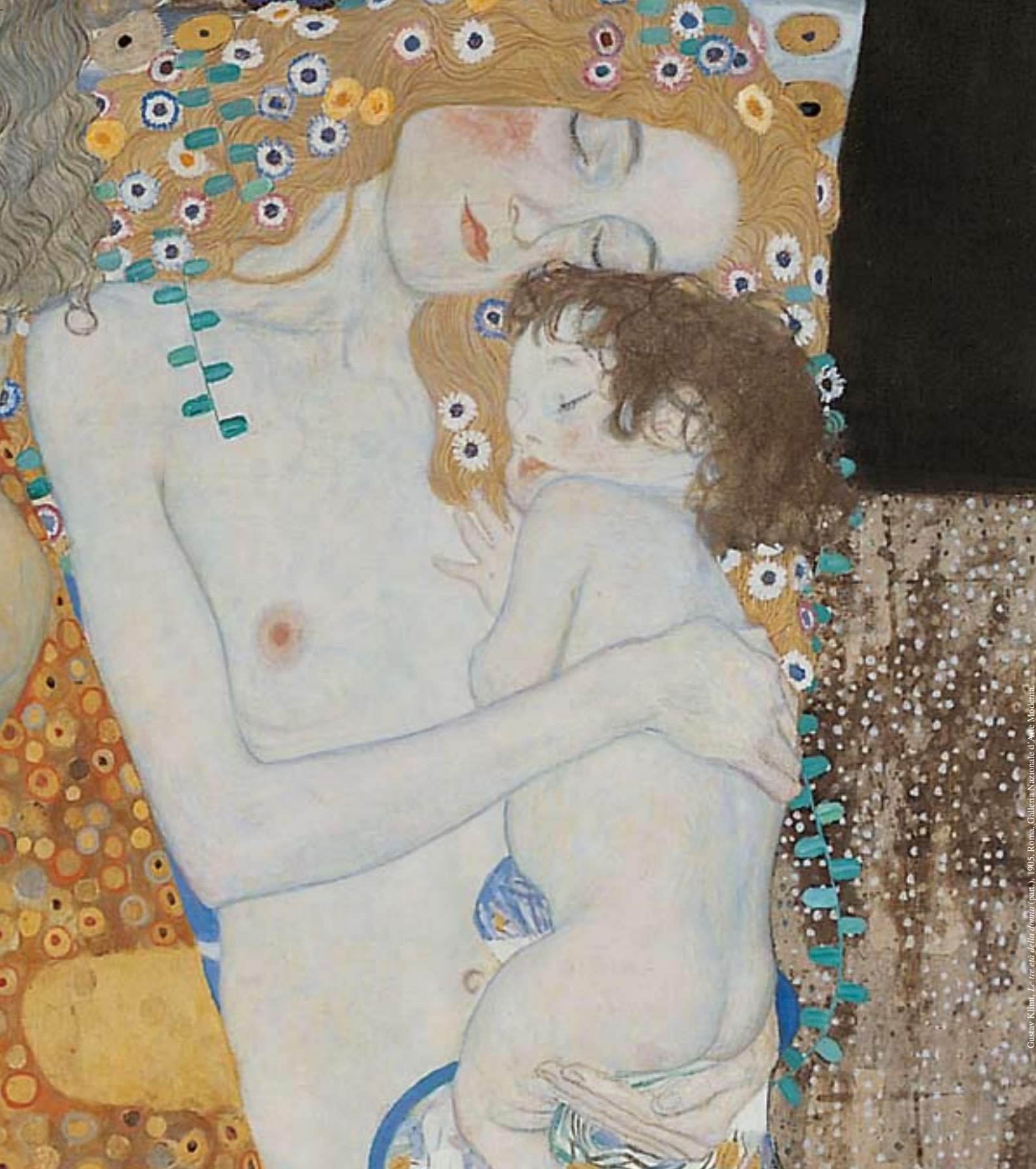
Gustav Klimt, Le tre età della donna (part.) , 1905, Roma, Galleria Nazionale d'Arte Moderna.