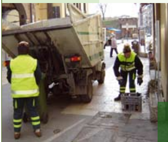
Raccolta differenziata del vetro in centro