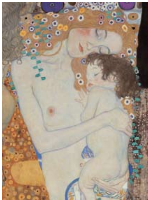
Gustav Klimt, Le tre età della donna, 1905, Olio su tela, cm 180 x 180,

E opere che ancora parlano al nostro inconscio e affrontano paure e tabù