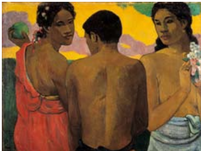
Paul Gauguin, Conversazione, 1899 Olio su tela, cm 73 x 93 Edimburgo, National Gallery of Scotland Edimburgo, © The National Gallery of Scotland

La mostra prende avvio con i "precursori", quegli artisti vi-